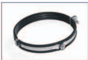
Légtechnikai csőbilincs M8-M10 felfüggesztéssel Max ajánlott terhelés: DIN 24145 Zaj csillapítás: 16-18dB-ig zajszigetelő betét, 80-315mm-ig egyoldalú gyors csatlakozással, 315 mm-től két oldali csavarozással. Horganyzott, Cr6 mentes!