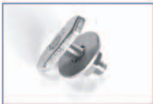
FT Kalapácsfejű csavarok Hammerkopfschrauben M10X35 Méretek: M8x35 M10x35 M10x80 horganyzott, Cr6 mentes!