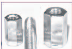
Menetes szár toldó M8-M10 Ez egyszerűbb és olcsóbb is de nem olyan jó minőségű horganyzott, Cr6 mentes!