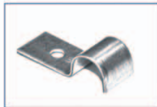
Cső leszorító horganyzott, Cr6 mentes!